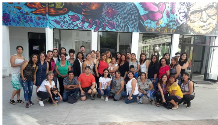
Fotografía año 2019

Este curso de formación constituye un aporte central al desarrollo de cuidados progresivos de personas mayores y/o personas en situación de discapacidad, posibilitando el desarrollo de vidas independientes. Asimismo representa una oportunidad de jerarquización y mejora en las condiciones de trabajo y empleabilidad para aquellas personas que se desempeñan en el ámbito del cuidado de personas.